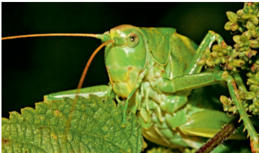
Grünes Heupferd mit kräftigen Mundwerkzeugen

Kurzfühlerschrecken sind reine Pflanzenfresser, die Grashüpfer fressen sogar fast ausschließlich Gräser. 1749 wur-