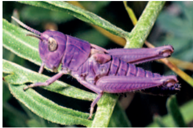
Heidegrashüpfer-Larve mit seltener Farbabweichung

beschriebene Merkmale wie Länge der Flügel und Verlauf der Adern, Hinterleibsanhänge etc. heranzuziehen. Viele Arten können einfacher nach dem Gesang bestimmt werden.