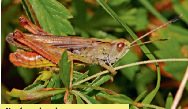
Rote Keulenschrecke Gomphoceris rufus