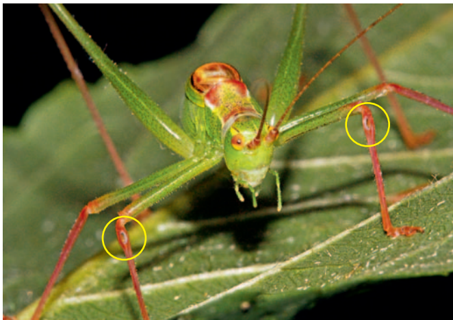
Punktierte Zartschrecke (Schienen mit ovalem Gehörorgan)

An der Brust der Heuschrecken setzen alle Bewegungsorgane (sechs Beine und zwei Paar Flügel) sowie das Halschild an. Bei den Dornschröcken ist dieses nach hinten verlängert und bedeckt den Hinterleib. Das hintere Beinpaar ist bei allen Heuschreckenarten kräftig entwickelt und verhilft den Tieren zu ihrer außerordentlichen Sprungfähigkeit. Dennoch ist die Ausbreitungsfähigkeit vor allem bei den nur