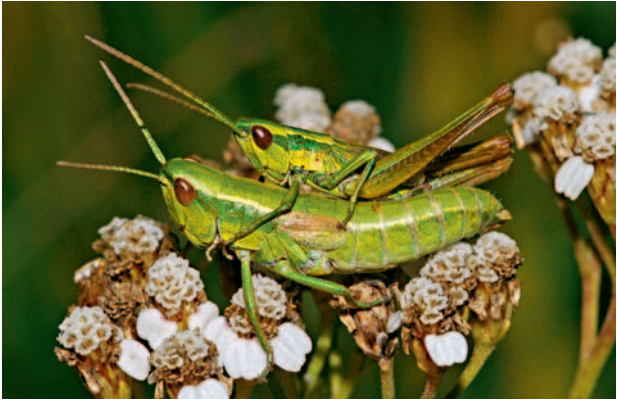
Kleine Goldschrecke (Paarung)