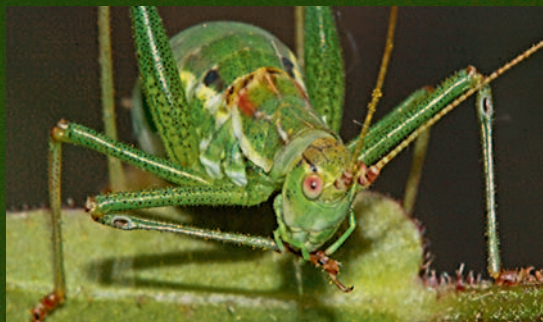
Gestreifte Zartschrecke beim »Fußputz«