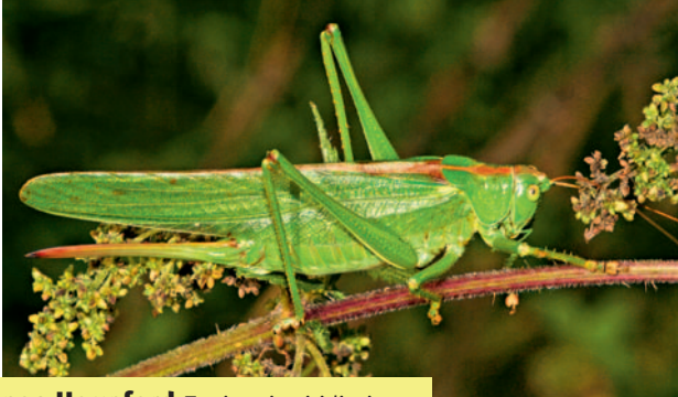
Grünes Heupferd Tettigonia viridissima