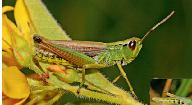
Sumpf-Grashüpfer Chorthippus montanus