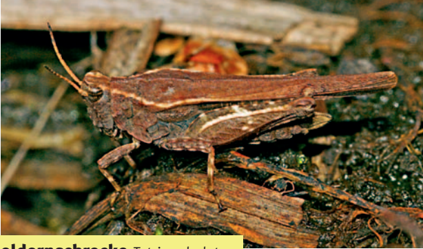
Säbeldornschröcke Tetrix subulata