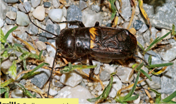
Feldgrille Gryllus campestris