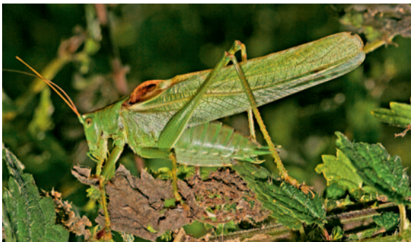
Grünes Heupferd singend

Heuschrecken haben unter den wirbellosen Tieren die auffälligsten Laute entwickelt. Der Gesang wird meist nur von Männchen vorgetragen und dient v. a. dem Anlocken der