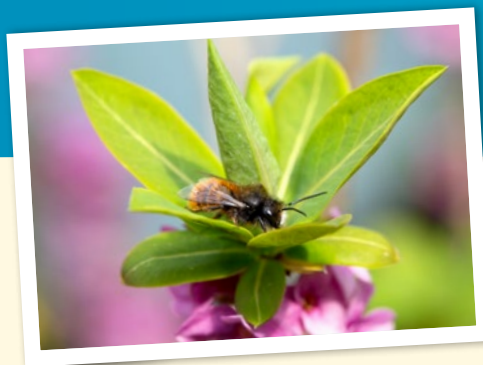
Zweifarbige Schnecken- hausbiene