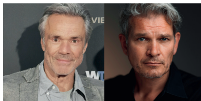
Hannes Jeanicke Götz Otto